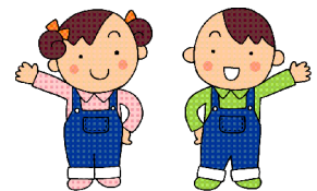
「愛食運動」イメージキャラクター 大地くんとめぐみちゃん

「愛食運動」とは、北海道が推進する「道民みんなで身近な道産食品の良さを理解し、もっと愛用しましょう」という運動です。セイコーマートの「北海道メロンフェア」も愛食運動につながる取り組みです。