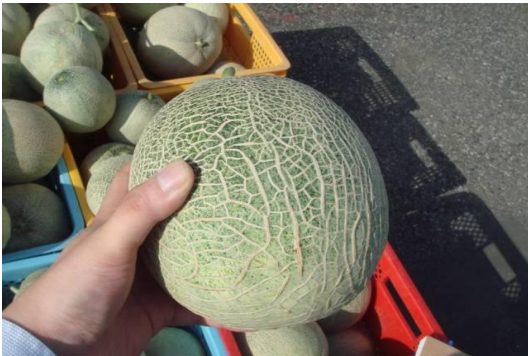
①ツルがない規格外品のメロン。果肉は正規品と変わりません。メロンから果汁を搾ります。