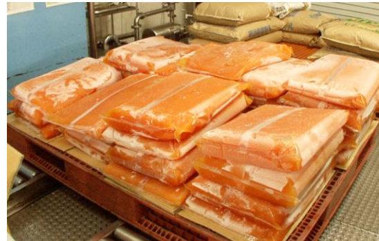
②メロンから搾り出したメロン果汁。