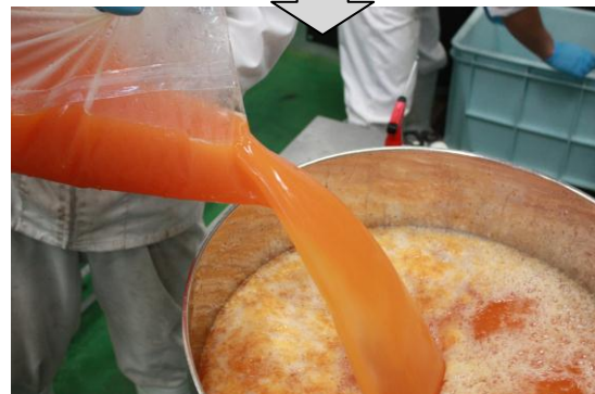
③メロン果汁を様々な商品にたっぷり使用。