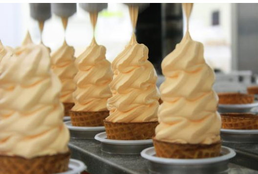
④アイスや大福、飲料、ゼリーなど17アイテムを開発し製造。