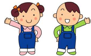
「愛食運動」イメージキャラクター 大地くん と めぐみちゃん

「愛食運動」とは、北海道が推進する「道民みんなで身近な道産食品の良さを理解し、もっと愛用しましょう」という運動です。セイコーマートの「北海道メロンフェア」も愛食運動につながる取り組みです。